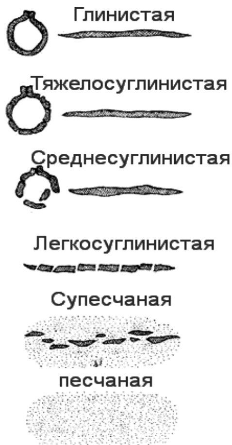
Рис. 1. Виды почв

Для первой группы характерно строгое нормирование расстояний между растениями в двух взаимно перпендикулярных направлениях, что допускает движение машин по занятому культурой полю в двух направлениях и позволяет практически постоянно механизировать обработку почвы во время роста растений.